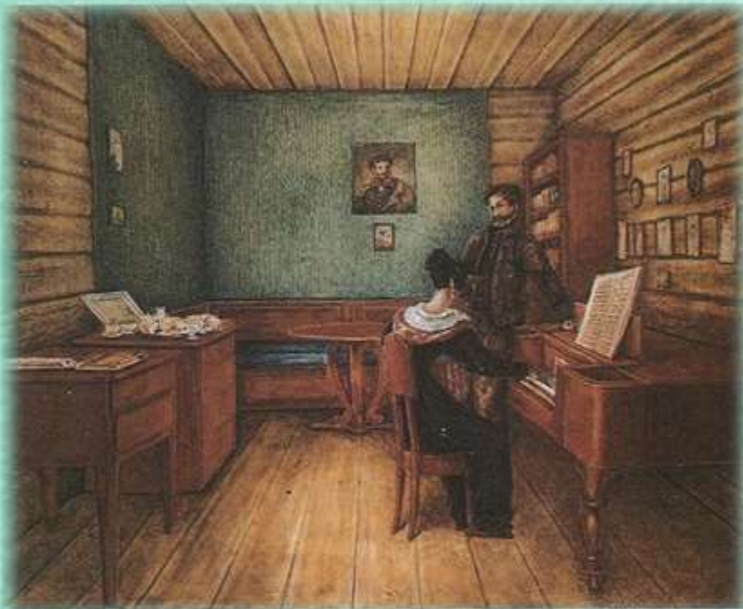
комната Волконских в Петровском заводе

Когда Мария с разрешением на выезд в Сибирь пришла к отцу, он в гневе сказал ей: «Я тебя прокляну, если ты через год не вернёшься» ... И только в 1829 году, перед смертью, он назвал свою любимую дочь «самой удивительной женщиной, которую когда-либо знал».