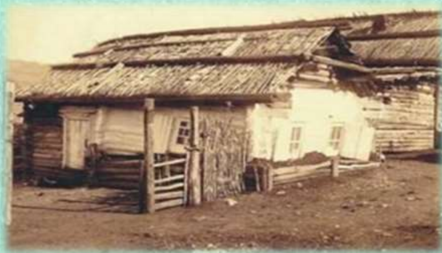
дом Трубецкой и Волконской в Благодатском руднике

Она первая из жён декабристов добилась разрешения отправиться за мужем в ссылку. «Я, право, чувствую, что не смогу жить без тебя. Я все готова снести с тобою, не буду жалеть ни о чем, когда буду с тобой вместе. Меня будущее не страшит. Спокойно прощусь со всеми благами светскими. Одно меня может радовать: тебя видеть, делить твою горе и все минуты жизни своей тебе посвящать. Меня будущее иногда беспокоит на твой счет. Иногда боюсь, чтоб тяжкая твоя участь не показалась тебе свыше сил твоих... Мне же, друг мой, все будет легко переносить с тобою вместе, и чувствую, ежедневно сильнее чувствую, что как бы худо нам ни было, от глубины души буду жребий свой благословлять, если буду я с тобою» (Из письма Екатерины Трубецкой мужу в Петропавловскую крепость, декабрь, 1825 г.).