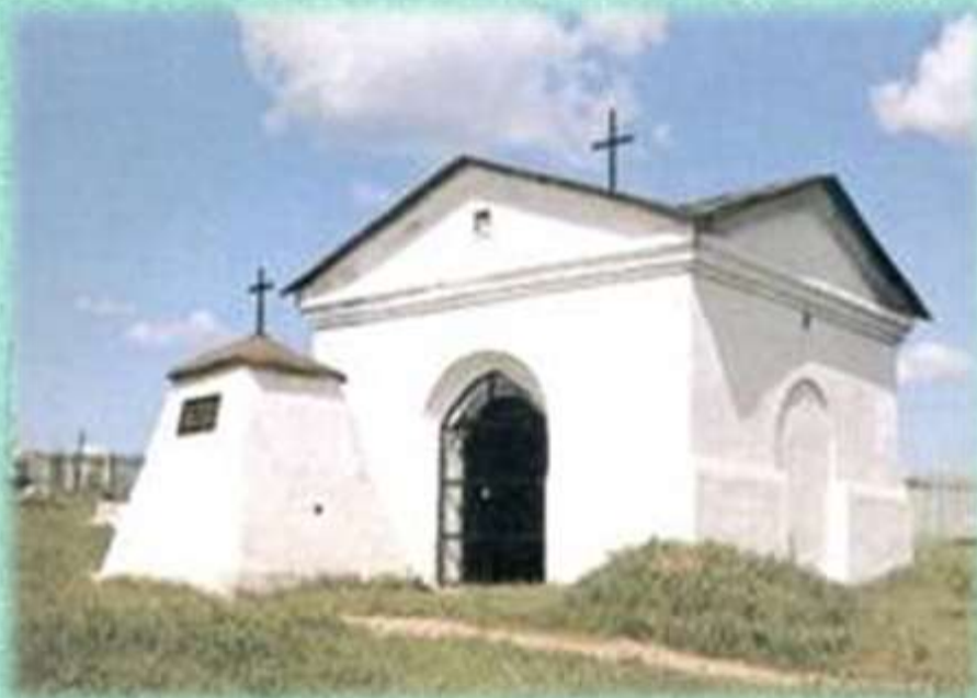
Часовня в Петровском заводе над могилой А. Муравьевой

Над могилой А. Муравьевой муж построил часовню, в которой, говорят, светилась неугасимая лампада еще 37 лет после её смерти.