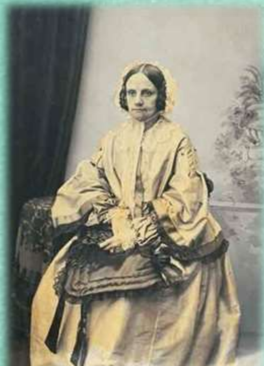
Мария Николаевна Волконская. Москва. 1857.

Оправившись после родов, она поехала в Петербург, чтобы увидеться с мужем, но для этого ей понадобилось обращение к императору Николаю I, что она и сделала. А после оглашения приговора декабристам она сразу же приняла решение следовать за мужем. Её отговаривали все родные, отец даже согласен был на её развод с Волконским, но все было тщетно: Мария впервые послушалась отца. А когда её спросили, уверена ли она, что возвратится, она ответила: «Я и не желаю возвращаться, разве лишь с Сергеем, но, Бога ради, не говорите этого моему отцу».